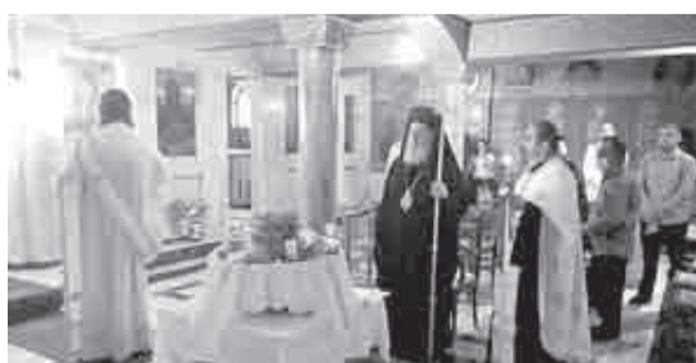
Από την εορτή των Αγίων Ραφαήλ, Ελένης και Νικολάου στο ομώνυμη παρεκκλήσιο του Αγίου Νεκταρίου

Στην ομιλία του ο Θεοφιλέστατος αναφέρθηκε στο γεγονός της Αναστάσεως του Σωτήρος Χριστού το οποίο ενέπνευσε το μαρτύριο των Αγίων κάθε εποχής. «Οι Νεομάρτυρες στην καρδιά τους είχαν αγάπη για τον Χριστό και την Ελλάδα. Στα δύσκολα χρόνια της σκλαβιάς και της Τουρκοκρατίας το νέφος των Νεομαρτύρων ενίσχυε τους υπόδουλους Χριστιανούς στην διατήρηση της Ορθόδοξης πίστεως και της αγά-