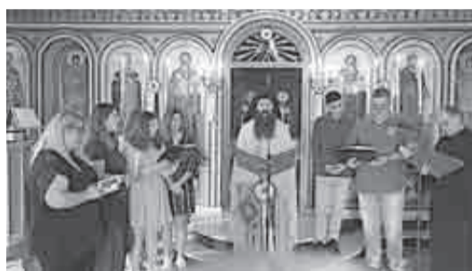
Ο Εσπερινός της Αγάπης στον ιερό ναό της Αγίας Ειρήνης Ριγανοκάμπου