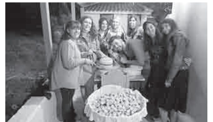
Τα παιδιά της Νεανικής Ομάδας της Αγίας Ειρήνης βοήθησαν, μεταξύ άλλων, και στο κόψιμο των αντίδωρων