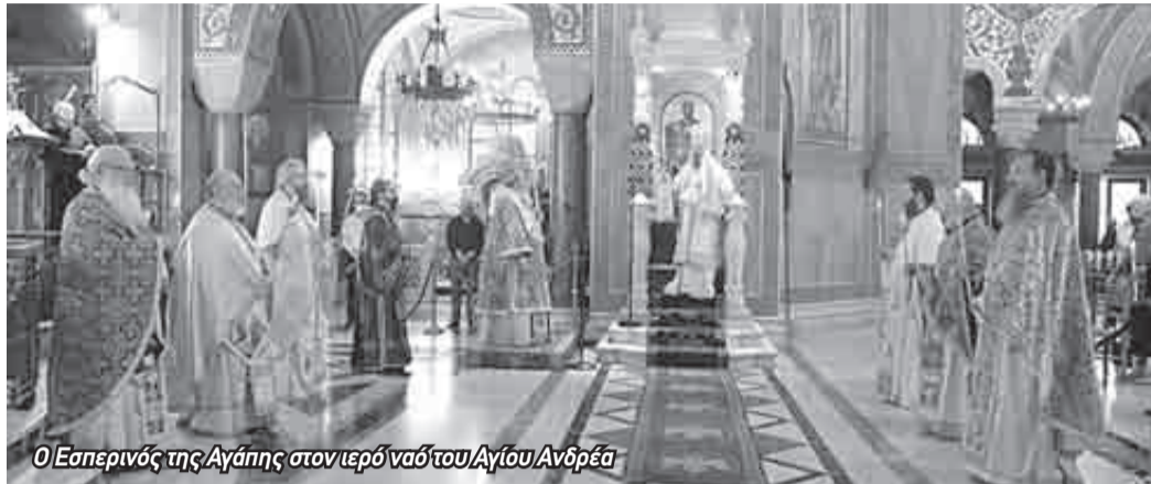
Ο Εσπερινός της Αγάπης στον ιερό ναό του Αγίου Ανδρέα

Ο εσπερινός της Αγάπης τελέστηκε και στις ιερές μονές Γηροκομείου (το Ευαγγέλιο αναγνώστηκε σε Ελληνικά, Αγγλικά και Τούρκικα) και Ομπλού (το Ευαγγέλιο εψάλη σε 7 γλώσσες, Ελληνικά, Λατινικά, Αγγλικά, Γαλλικά, Γερμανικά, Ιταλικά, Ισπανικά). Παράλληλα, η Ακολουθία τελέστηκε και στον ιερό ναό Αγίας Ειρήνης Ριγανοκάμπου, στον ιερό ναό Αγίων Θεοδώρων Δεμενίκων, στον ιερό ναό Αγίας Μαρίνας, κ.ά.