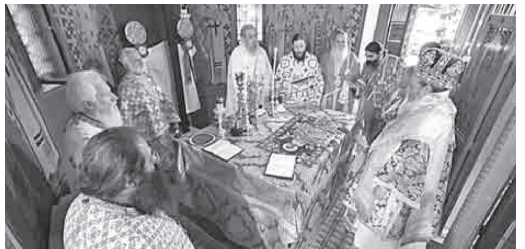
Ο Θεοφιλέστατος Επίσκοπος Κερνίτισης κ. Χρυσάνθος χοροστάτησε της Αρχιερατικής Θείας Λειτουργίας

Δείτε πλούσιο φωτογραφικό αφιέρωμα από τον διήμερο εορτασμό της Αγίας Ειρήνης.