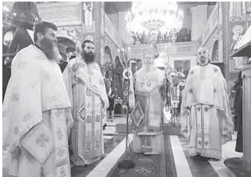
Ο Θεοφιλέστατος Επίσκοπος Κερνίτισης κ. Χρυσάνθος στον ιερό ναό του Αγίου Γεωργίου στο Μιντιλόγι

Συνεχίζονται οι ετοιμασίες στην ιερά Μητρόπολη πατρών για την αιμοδοσία που θα πραγματοποιηθεί το διάστημα 10 με 22 Μαΐου στην πλατεία βασιλέως Γεωργίου Α'.