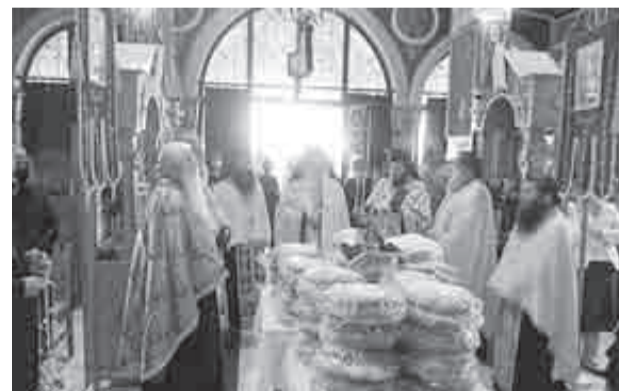
Από τον μέγα πανηγυρικό εσπερινό μετ' αρτοκλασίας της 4ης Μαΐου