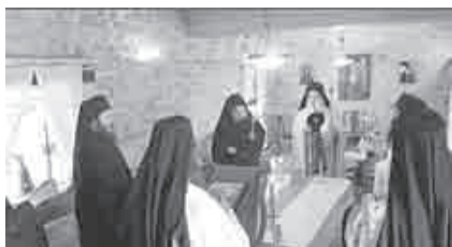
Εσπερινός της Αγάπης και για την μοναστική αδελφότητα της ιεράς μονής Ομπλού