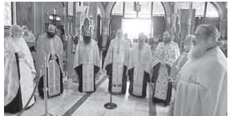
Στιγμιότυπο από τον εσπερινό και την ιερά παράκληση της 5ης Μαΐου

> Πλήθος κόσμου στην εορτή της Αγίας Ειρήνης Ριγανοκάμπου