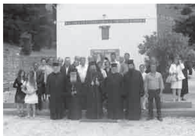
Προσκυνηματική εκδρομή στην ιερά μονή Νοτενών