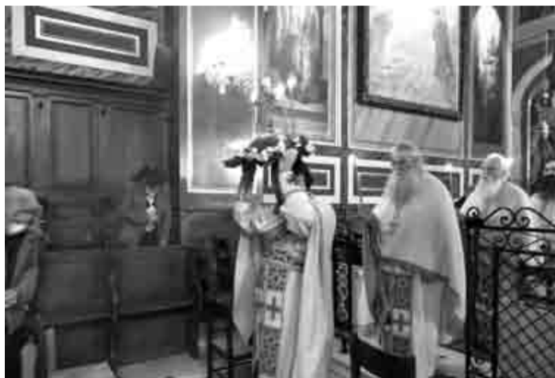
Ο Σεβασμιώτατος Μητροπολίτης Πατρών κ.κ. Χρυσόστομος έστειλε ένα ιδιαίτερο μήνυμα ανήμερα της Σταυροπροσκυνήσεως

Με ιερά κατάνυξη γιορτάστηκε η Κυριακή της Σταυροπροσκυνήσεως στην Πάτρα.