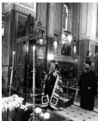
Ο Σεβασμιώτατος Μητροπολίτης Πατρών κ.κ. Χρυσόστομος στον Δ' κατανυκτικό Εσπερινό

Στον Δ' κατανυκτικό Εσπερινό που τελέστηκε στον ιερό Μητροπολιτικό ναό Ευαγγελιστρίας, χοροστάτησε και μίλησε ο Σεβασμιώτατος Μητροπολίτης Πατρών κ.κ. Χρυσόστομος, ο οποίος αναφέρθηκε στην θεολογία του Τιμίου και Ζωοποιού Σταυρού. Μίλησε για τη διάσπαση της σταυρικής και αγαπτικής σχέσεως του ανθρώπου με τον Θεό, του ανθρώπου με τον συνάνθρωπο και του ανθρώπου με την σύμπασα κτίση, μετά την αμαρτία και αποστασία των Πρωτοπλάτων. «Η ενότης του ανθρώπου με τον Θεό και με τον συνάνθρωπο και με την σύμπασα κτίση απεκαταστάθη δια του Τιμίου και Ζωοποιού Σταυρού πάνω στο οποίο ήπλωσε τας άχράντους Αυτού Παλάμας ο Ζωοδότης Κύριος».