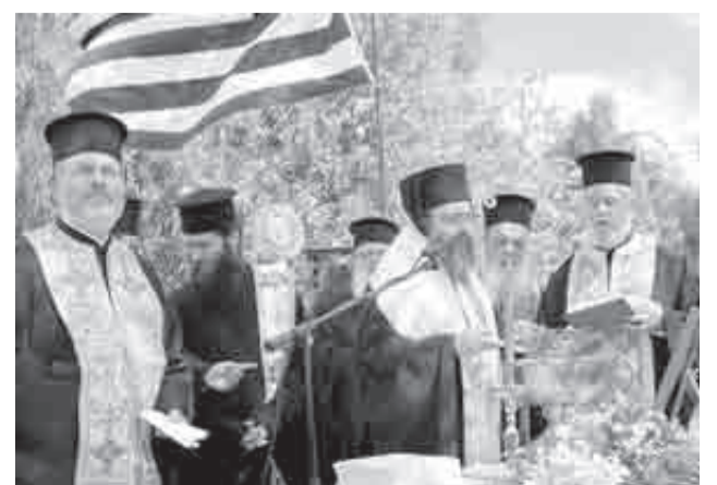
Από την τοποθέτηση του θεμελίου λίθου