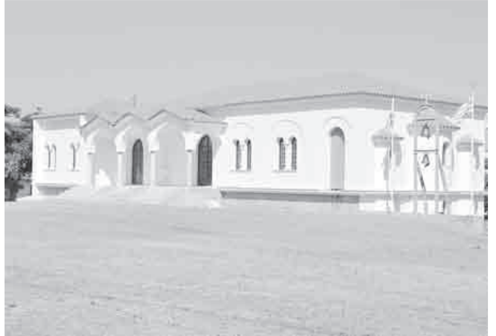
Ο ιερός ναός Αγίου Ιωακείμ Νοτενών Εξω Αγυιάς όπως είναι σήμερα

Ετσι λοιπόν στις 2 Αυγούστου 2005 συνεστήθη η πρώτη Ερανική Επιτροπή για την ανέγερση του νέου ενοριακού ναού του Οσίου Ιωακείμ Εξω Αγυιάς, ενώ το διάστημα των 15 μηνών, από τον Οκτώβριο του 2005 έως και τον Δεκέμβριο του 2006, η Επιτροπή εργάστηκε με ζήλο και αυταπάνηση προκειμένου να συγκεντρώσει τα αναγκαία χρήματα για να κατοχυρώσει μια έκταση 2.840 τ.μ., η οποία ήταν χαρακτηρισμένη ως χώρος Εκκλησίας από ετών. Η Επιτροπή αποζημίωσε τμήμα του οικοπέδου (αναγκαία προϋπόθεση), εμβαδού 420,70τ.μ., το οποίο ανήκε σε ιδιώτες, διά του ποσού των 54.000 ευρώ συν τα συμβολαιογραφικά και αποδέχθηκε τη γενναία προσφορά έκτασης εμβαδού 2.640τ.μ. του Δήμου Πατρέων, καταβάλλοντας το ποσό των 14.000 ευρώ για τα εξοδα των συμβολαίων. Το διάστημα Ιανουάριος με Ιούλιος του 2007 ακολούθη-