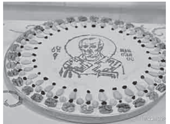
Περίτεχνος δίσκος κολλύβων στη μνήμη του Αγίου Νικολάου

αστυνομικών και άλλων τοπικών αρχών. Το απόγευμα της εορτιού