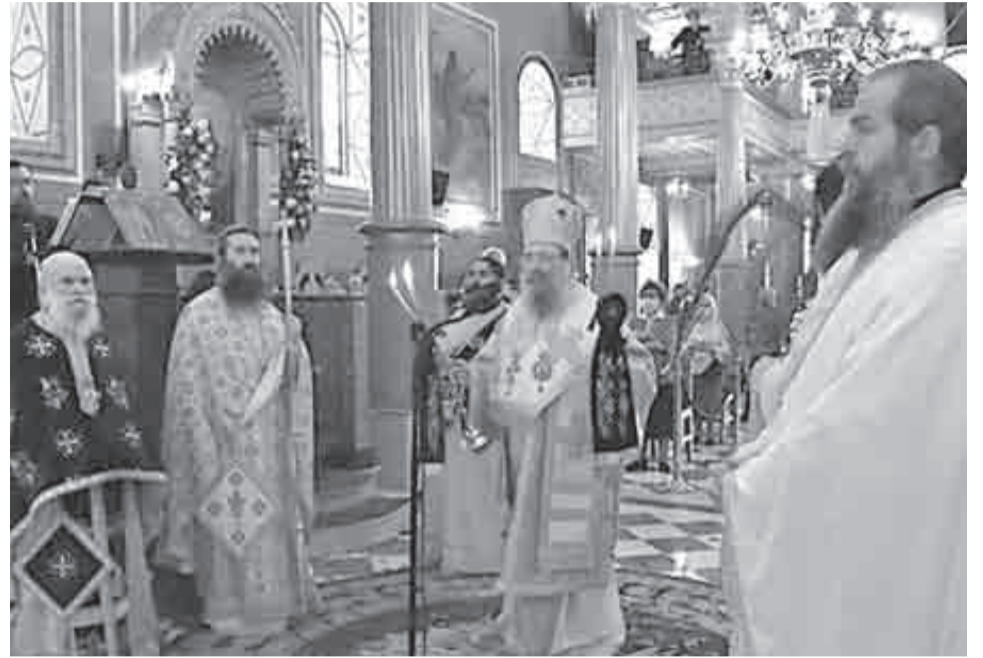
Ο Σεβασμιώτατος Μητροπολίτης Πατρών κ.κ. Χρυσόστομος στην εορτή της μετακομιδής των λειψάνων του Αγίου Νικολάου

Ανήμερα χοροστάτησε στον Ορθρο και τέλεσε τη Θεία Λειτουργία ο Σεβασμιώτατος Μητροπολίτης Πατρών κ.κ. Χρυσόστομος, ο οποίος μίλησε στους πιστούς με θέμα: «Η μεγάλη ευλογία από τον Θεό να έχουμε τα λείψανα των Αγίων». Κατά την Θεία Λειτουργία εκκλησιάσθησαν ο Αντιπεριφερειάρχης Αχαΐας, Χαράλαμπος Μπονάνος, οι βουλευτές Αχαΐας της Νέας Δημοκρατίας, Άγγελος Τσιγκρής και Ιάσωνας Φωτήλας και εκπρόσωποι των