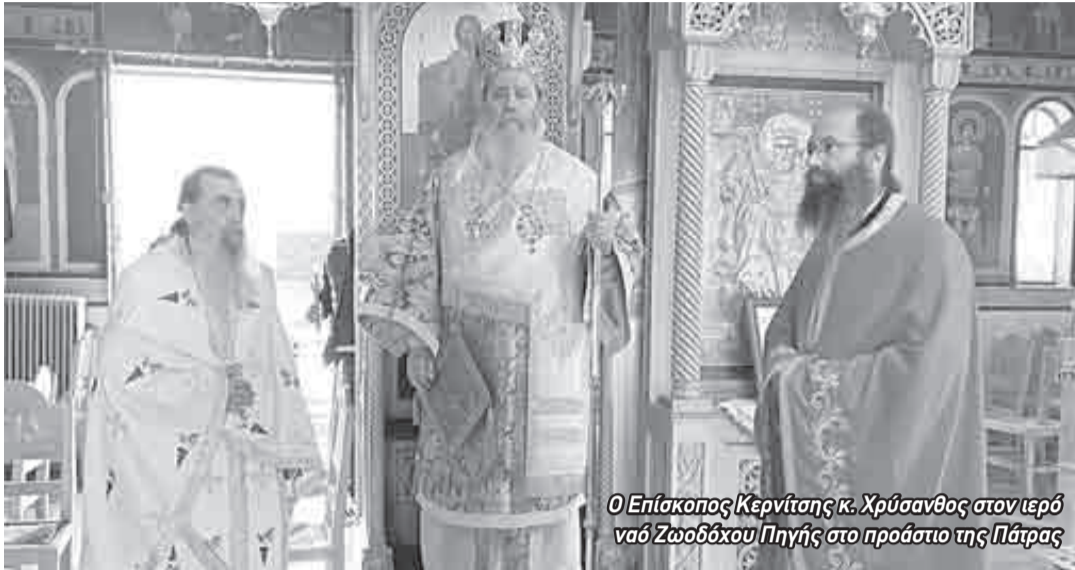
Ο Επίσκοπος Κερνίτσης κ. Χρυσάνθος στον ιερό ναό Ζωοδόχου Πηγής στο προάστιο της Πάτρας

Την Παρασκευή 7 Μαΐου, ο Θεοφιλέστατος προεξήρχε της ευχαριστιακής συνάξεως στον πανηγυρίζοντα Ιερό Ναό Ζωοδόχου Πηγής Προαστίου Πατρών. Ο Επίσκοπος Κερνίτσης στην ομιλία του αναφέρθηκε στην «Κυρία Θεοτόκο, η οποία κατά τον Ευαγγελισμό αποδέχθηκε με ταπεινότητα τη χαρμόσυνη είδηση ότι θα γεννήσει το Σωτήρα και Λυτρωτή του κόσμου. Η Παναγία αναδείχθηκε Πηγή της Ζωής καθώς έγινε το όργανο της Θείας Χάριτος και δι' Αγίου Πνεύματος σαρκώθηκε μέσα της το δεύτερο πρόσωπο της Αγίας Τριάδος, ο Υιός και Λόγος του Θεού. Η Υπεραγία Θεοτόκος πόνεσε ανθρωπίνως αντικρίζοντας τον υιό και Θεό της επί του Σταυρού και αξιώθηκε να τον προσκυνήσει αναστάνα τριήμερο εκ του Ζωοδόχου Τάφου». Ο Θεοφιλέστατος προέτρεψε τους πιστούς να καταφεύγουν στη χάρη της Παναγίας σε κάθε στιγμή της ζωής τους, «ιδιαιτέρως και αυτές τις δυσκόλους ημέρες που περνά όχι μόνον η πατρίδα μας, αλλά και ολόκληρος ο κόσμος, εκζητώντας τη μεσιτεία της και την άνωθεν παρηγορία της».