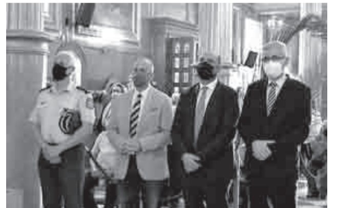
Παρούσα η ΕΛΑΣ, όπως και ο Αντιπεριφερειάρχης Αχαΐας, Χαράλαμπος Μπονάνος και οι Βουλευτές Αχαΐας της ΝΔ, Ιάσωνας Φωτήλας και Άγγελος Τσιγκρής