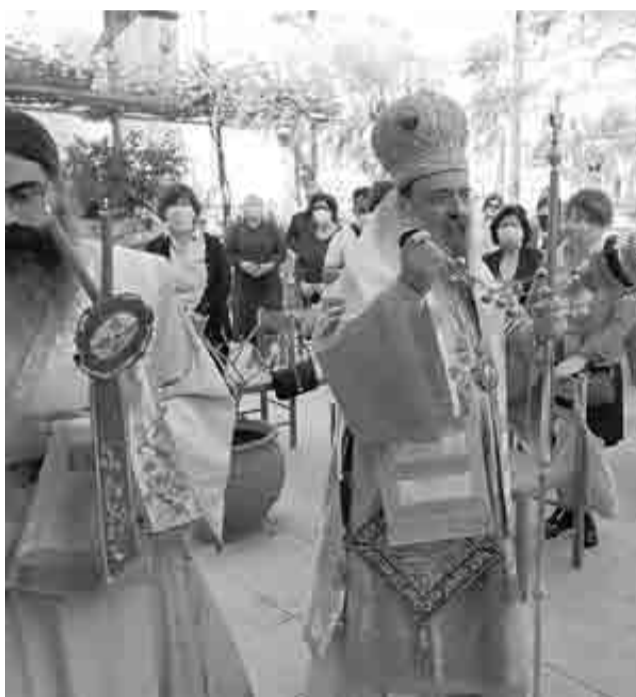
Ο Σεβασμιώτατος Μητροπολίτης Πατρών κ.κ. Χρυσόστομος μίλησε στον Άγιο Ιωάννη τον θεολόγο και στο νοσοκομείο «Παναγία η Βοήθεια» για τη μάχη που δίνουν γιατροί και νοσηλευτές όλους αυτούς τους μήνες με τον Covid-19

«Ηγαπημένος μαθητής, Παρθένος και Θεολόγος». Είναι τα τρία στοιχεία που χαρακτηρίζουν τον Άγιο Ιωάννη, τον ευαγγελιστή της Αγάπης, με τον Σεβασμιώτατο Μητροπολίτη Πατρών κ.κ. Χρυσόστομο να περιγράφει αυτές τις τρεις έννοιες κατά την ομιλία του στον εορτασμό του ιερού ναού Αγίου Ιωάννου του Θεολόγου του Επισκοπείου Πατρών, τον οποίο ανήγειρε εκ θεμελίων, ο αοίδιμος Αρχιεπίσκοπος Πατρών και Ηλείας (και μετέπειτα Μητροπολίτης Πατρών) Ιερόθεος Μητρόπουλος, το έτος 1899. Παράλληλα, ο Σεβασμιώτατος ευχήθηκε «ο Θεός να απαλλάξει την πατρίδα μας και τον κόσμο όλον από τη δοκιμασία της λοιμικής νόσου