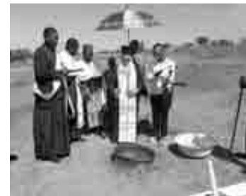
Στιγμιότυπο από τις βαπτίσεις στο χωριό Μπάλα

Το μυστήριο του βαπτίσματος στο χωριό Μπάλα στο κέντρο της Αφρικανικής ηπείρου! Παρά την κούραση, λόγω των μεγάλων αποστάσεων και του κακού οδικού δικτύου, ο (πατρινός) Μητροπολίτης Κανάγκας κ. Θεοδόσιος με τους συνεργάτες του είχαν ιερό σκοπό, να κάνουν νέους Χριστιανούς στο χωριό Μπάλα, τελώντας το μυστήριο της βάπτισης στους κατχουμένους της περιοχής. Ο εφημέριος της ενορίας αυτής, π. Ευφραίμ, με πολύ ζήλο, περιοδεύει όλη την περιοχή, καλύπτοντας τις πνευματικές και λειτουργικές τους ανάγκες.