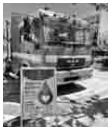
Ο χώρος που πραγματοποιείται η αιμοδοσία στο κέντρο της Πάτρας

Σε εξέλιξη βρίσκεται η αιμοδοσία της Ιεράς Μητροπόλεως Πατρών στην πλατεία βασιλέως Γεωργίου Α', σε μια περίοδο που οι ανάγκες για συλλογή αίματος είναι πολύ μεγάλες. Καθημερινά και τις ώρες 9.30π.μ. έως 1.30π.μ. και 5.30π.μ. έως 8.30π.μ., εκτός Κυριακής και Δευτέρα, Τετάρτη και Σάββατο μόνο πρωί, η κινητή μονάδα περιμένει τους πιστούς και όλους τους πατρινοίς για να εκπληρώσουν, όσοι φυσικά η υγεία τους το επιτρέπει, αυτήν την θεάρεστη πράξη. Η δράση πραγματοποιείται με την ευλογία του Σεβασμιωτάτου Μητροπολίτη Πατρών κ.κ. Χρυσόστομου και με βασιλικό σύνθημα «Δώστε αίμα και σώστε ζωές», ενώ θα ολοκληρωθεί το Σάββατο 22/5.