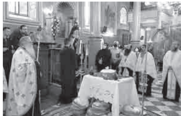
Ο Θεοφιλέστατος Επίσκοπος Κερνίτσας κ. Χρυσάνθος χοροστάτησε στον πανηγυρικό Εσπερινό

ημέρας εψάλη η ιερά παράκληση στον Άγιο Νικόλαο και τελέσθηκε το μυστήριο του ιερού ευχελαίου. Δείτε φωτογραφίες από τον διήμερο εορτασμό.