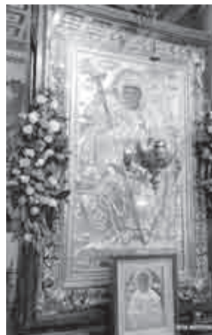
Η θαυματουργή εικόνα του Αγίου Νικολάου