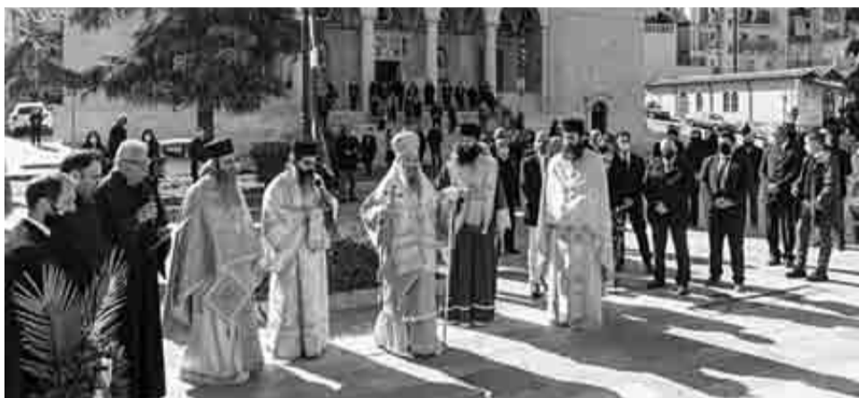
Η Ιερά Μητρόπολη Πατρών και ο Σύλλογος των εν Πάτραις Γορτυνίων τίμησε με τον δέοντα τρόπο την επέτειο από τη μαρτυρική θυσία του Πατριάρχη Κωνσταντινουπόλεως Γρηγορίου Ε΄

ΓΟΡΤΥΝΙΟΙ ΚΑΙ ΑΡΚΑΔΕΣ Ο εορτασμός για την επέτειο της θυσίας του Γρηγορίου Ε΄ πραγματοποιήθηκε στον ιερό ναό της Παντάνασσας, εκεί όπου βρίσκεται η ιερά εικόνα του ενδόξου Εθνοϊερομάρτυρος, ενώ και στον προαύλιο χώρο της εκκλησίας, δεσπόζει η προτομή του, κατασκευασμένη από τους συμπατριώτες του, Γορτυνίους τών Πατρών. Οι εορτασμοί, όπως κάθε χρόνο, έγιναν με την συνεργασία της Ιεράς Μητροπόλεως Πατρών και του ιστορικού Συλλόγου των εν Πάτραις Γορτυνίων, τους οποίους ο Σεβασμιώτατος επαίνεσε από καρδιάς για την αφοσίωσή τους στην Ορθόδοξη Εκκλησία και την πατρίδα μας. Μετά το πέρας της Θείας Λειτουργίας και την ομιλία του Σεβασμιωτάτου, λιτανεύτηκε, από τον ναό έως την προτομή του Εθνάρχη Ιερομάρτυρου Πατριάρχου, η ιερά εικόνα του, ανεβέβηθη δέσση και κατετέθησαν στέφανοι από τους εκπροσώπους της Περιφέρειας,