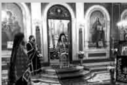
Στιγμιότυπο από τη Θεία Λειτουργία στον ιερό Μητροπολιτικό ναό της Ευαγγελιστρίας

Προηγιασμένη Θεία Λειτουργία τελέσθηκε την Τετάρτη, υπό του Σεβασμιωτάτου Μητροπολίτου Πατρών κ.κ. Χρυσόστομου, στον ιερό Μητροπολιτικό ναό Ευαγγελιστρίας Πατρών, επί τη ιερά μνήμη του αγίου ενδόξου νεομάρτυρος Δημητρίου, του εν Τριπόλει μαρτυρήσαντος (14 Απριλίου του 1803, Τρίτην, τότε της εβδομάδος του Θωμά). Ο Σεβασμιώτατος στο κήρυγμά του ανέφερε ότι ο μαρτύριο του κλεινού αριστέως της Πελοποννήσου και γενικώς στην ένδοξη σελίδα της Εκκλησίας και του Γένους κατά τα σκληρά και μαύρα χρόνια της Τουρκικής σκλαβιάς, μιας σελίδας που εγράφη και υπεγράφη με το αίμα των λαμπρών Νεομαρτύρων. Αναφερόμενος στη θυσία και την προσφορά των Αγίων Νεομαρτύρων, στην Ορθοδοξία και την Πατρίδα, ο Σεβασμιώτατος τόνισε ότι «τα λαμπρά αυτά παλληκάρια, είτε μαρτύρησαν παραμεινάντες Ορθόδοξοι μέχρι τέλους, είτε εξώμωσαν και ανέστησαν εκ του πώματος ομολογήσαντες Ιησούν Χριστόν, τέλειον Θεόν και τέλειον άνθρωπον, μαρτυρήσαντες υπέρ αυτής της αληθείας, είτε όντες μουσουλμάνοι, εβαπτίσθησαν και υπέστησαν μαρτυρικό τέλος (ως ο Νεομάρτυς αχμέτ,