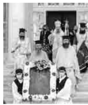
Η ιερή εικόνα του Πατριάρχη Γρηγορίου Ε΄

του Δήμου, του Επιμελητηρίου Αχαΐας, τους προέδρους των Συλλόγων των εν Πάτραις Γορτυνίων και Αρκάδων και άλλους εκπροσώπους τοπικών αρχών και φορέων. ΟΙ ΣΥΓΚΙΝΗΤΙΚΕΣ ΑΝΑΦΟΡΕΣ Ο Σεβασμιώτατος ανέφερε και τα εξής μέσα σε κλίμα συγκίνησης: «Μακαρίζουμε τον πατέρα και διδάσκαλο του Γένους μας, που σε χρόνια δίσεκτα σήκωσε τον βαρύ σταυρό της μαρτυρικής πορείας, μιας χώρας, η οποία στέναζε κάτω από το πέλημα του Τούρκου κατακτητού, της μάνας της μεγαλόψυχης στον πόνο και στο δάκρυ, της Ελλάδος δηλαδή και κράτησε στους ώμους του, της Ρωμοσύνης