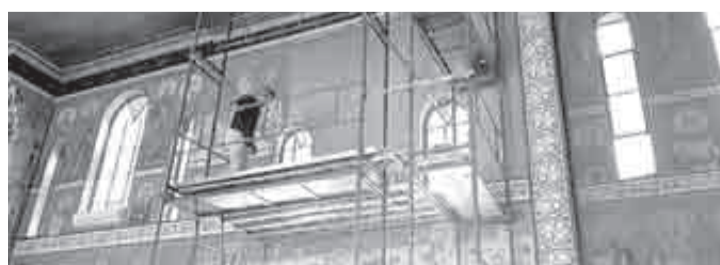
Ξεκινούν οι αγιογραφίες στον ιερό ναό Κοιμήσεως Θεοτόκου Οβρυάς

Με την χάρη του Θεού ξεκίνησε η τοποθέτηση σκαλωσιάς στην πλευρά του κλίτους των γυναικών στον ιερό ναό της Κοιμήσεως Θεοτόκου της Οβρυάς και τις αμέσως επόμενες ημέρες θα ξεκινήσει η τοποθέτηση των αγιογραφιών.