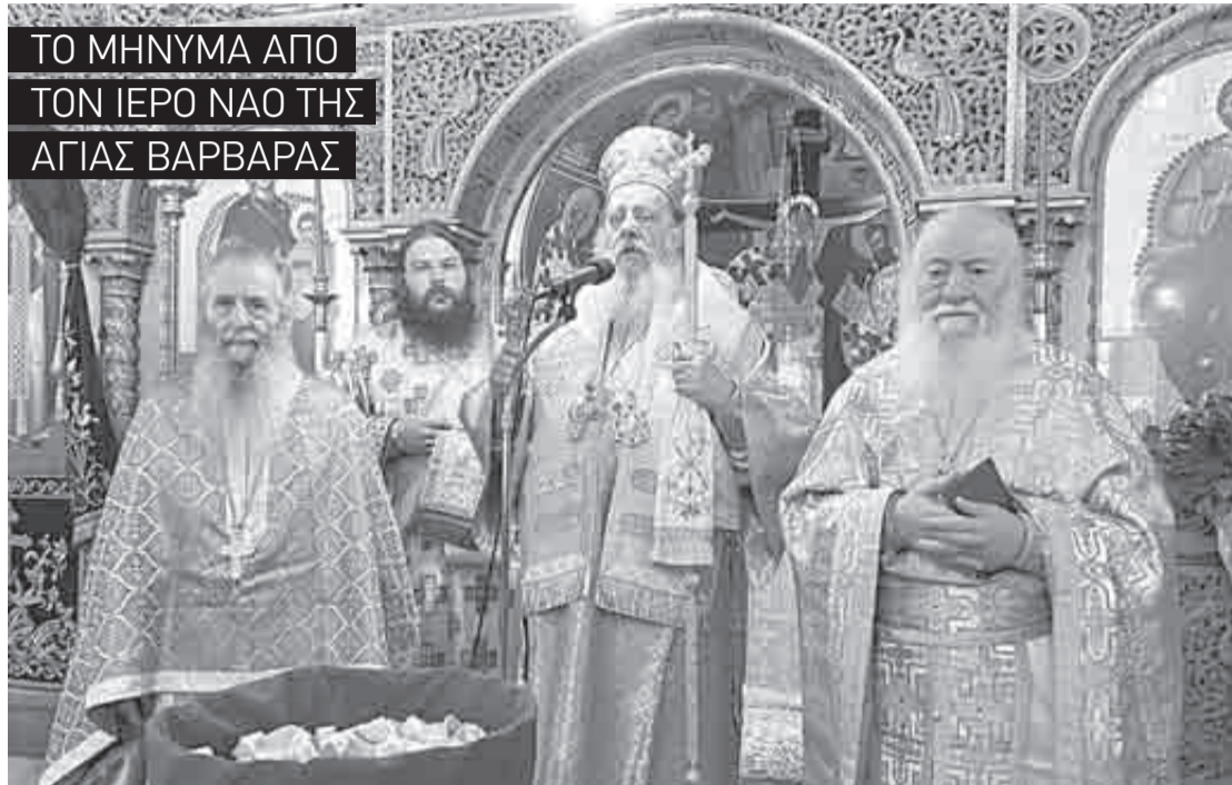
Ο Θεοφιλέστατος Επίσκοπος Κερνίτσης στον ιερό ναό της Αγίας Βαρβάρας

Α ρχιερατική Θεία Λειτουργία τελέστηκε την περασμένη Κυριακή στον ιερό ναό Αγίας Βαρβάρας, προεξάρχοντος του Θεοφιλεστάτου Επισκόπου Κερνίτσης κ. Χρυσάνθου. Ο Θεοφιλέστατος στην ομιλία του αναφέρθηκε στην ευαγγελική περικοπή της θεραπείας του δαιμονιζομένου νέου: «Στη ζωή του ο άνθρωπος έρχεται αντιμέτωπος με τρεις εχθρούς: τον διάβολο, τον κόσμο και τον κακό εαυτό του. Απέναντι στις παγίδες του μισοκάλου διαβόλου, ο πιστός θωρακίζεται με όπλα πνευματικά, μέσα στη μυστηριακή ζωή της Ορθόδοξου Εκκλησίας μας. Η προσευχή, η νηστεία, η επίκληση του ονόματος του Κυρίου μέσω της καρδιακής προσευχής "Κύριε Ιησού Χριστέ, Υιέ του Θεού, ελέησόν με τον αμαρτωλόν", το σημείο του Τιμίου και Ζωοποιού Σταυρού, οι ιερές Ακολουθίες και τα χαριτόβρυτα Μυστήρια της Εκκλησίας μας, ενισχύουν τον πιστό στον πνευματικό του αγώνα και τον σπρίζουν στην πορεία του προς τον Ουρανό». Και πρόσθεσε ο Θεοφιλέστατος: «Το δέντρο που βρίσκεται βαθιά ριζωμένο στη γη δεν φοβάται τους ορμητικούς ανέμους. Έτσι και ο πιστός, όταν εναποθέτει τις ελπίδες του στο Θεό και παραδίδεται ολοκληρωτικά σε αυτόν, αναγνωρίζοντας την αδυναμία και την αμαρτωλότητά του, δεν φοβάται τις παγίδες του διαβόλου και αναφωνεί όπως ο πατέρας του δαιμονιζομένου νέου "Πιστεύω, Κύριε, βοήθει με τη άπιστία"».