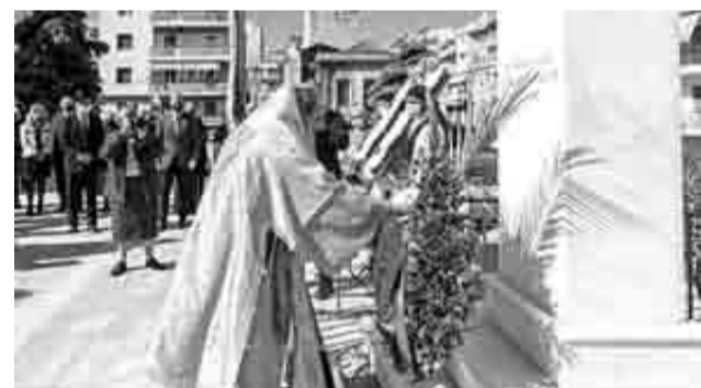
Ο Σεβασμιώτατος Μητροπολίτης Πατρών κ. Χρυσόστομος προσκυνά ευλαβικά το άγαλμα του Γρηγορίου Ε΄