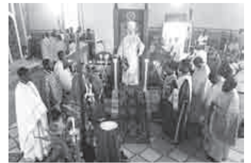
Από τη Θεία Λειτουργία την Κυριακή της Σταυροπροσκυνήσεως