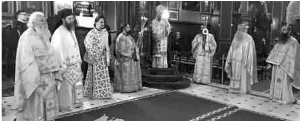
Ο Σεβασμιώτατος Μητροπολίτης Πατρών κ.κ. Χρυσόστομος (η φωτογραφία από ακολουθία στον ιερό Μητροπολιτικό ναό της Ευαγγελιστρίας) ευχαρίστησε όλους όσοι ανταποκρίθηκαν στον «Τηλεμαραθώνιο Αγάπης» ενόψει Πάσχα

Όπως συνέβη, λοιπόν, και τα Χριστούγεννα, έτσι και χθες η Ιερά Μητρόπολη Πατρών διοργάνωσε Τηλεμαραθώνιο Αγάπης, μέσα από την συχνότητα του «Λύχνου», με στόχο να συγκεντρωθεί ένα χρηματικό ποσό που θα διατεθεί στις φιλανθρωπικές δράσεις της τοπικής εκκλησίας καθό-