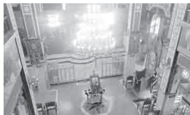
Άποψη του εσωτερικού του ναού από τον γυναικωνίτη