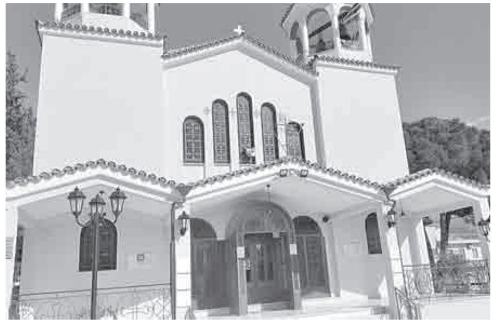
Εξωτερική άποψη του ιερού ναού των Αγίων Κωνσταντίνου και Ελένης της Αρόης