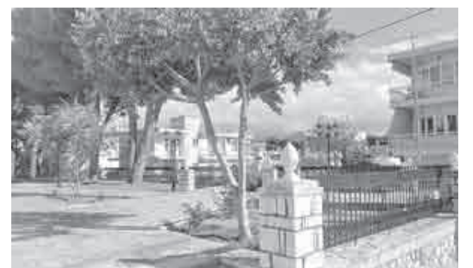
Το πάντοτε περιποιημένο προαύλιο του ιερού ναού της Αρόης