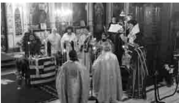
Η ελληνική σημαία σε περίοπτη θέση στην Ευαγγελίστρια

Η Εκκλησία κράτησε ψηλά την σημαία. Οχι μόνον την περίοδο του Αγώνα το 1821, αλλά και στις μέρες μας, σε καιρούς πανδημίας, όπου οι εκδηλώσεις για την επέτειο των 200 χρόνων από την έναρξη της Ελληνικής Επανάστασης συνέπεσαν με τα αυστηρά μέτρα λόγω της επέλασης του κορωνοϊού.