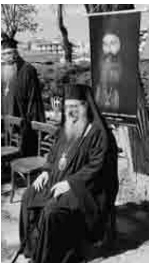
Ο Σεβασμιώτατος έχοντας πίσω του την αφίσα με τον Παλαιών Πατρών Γερμανό

«Αν δεν είμασταν Ορθόδοξοι Χριστιανοί, δεν θα είμασταν σήμερα ελεύθεροι». Το επαναλάμβανε συνεχώς ο Σεβασμιώτατος Μητροπολίτης Πατρών στις εκδηλώσεις ανήμερα της 25ης Μαρτίου, το έγραψε και στο μήνυμά του προς τους πιστούς της Ιεράς Μητροπόλεως Πατρών. Μεταξύ άλλων ανέφερε τα εξής: «Μέσα από τους αγώνες τετρακοσίων ετών, αλλά και κατά την Επανάσταση του 1821, και μετά ταύτα, φαίνεται περίτρανα ότι η Πατρίδα μας ελευθερώθηκε, επειδή οι ήρωες και μάρτυρες πατέρες μας είχαν βαθειά Πίστη στον αληθινό Θεό, η οποία τους κράτησε όρθιους σε ώρες μεγίστων δυσκολιών, κινδύνων και ποικίλων και φρικτών μαρτυριών. Αυτή την Πίστη, την Ορθόδοξη και Ιερά Παράδοση την κράτησαν ακεραία και την διέφυλαξαν ως κόρη οφθαλμού