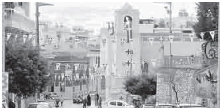
Στολισμένος ο Άγιος Νικόλαος και οι περιβάλλοντες χώροι

Αξιοι συγχαρητηρίων είναι οι ιερείς και οι υπεύθυνοι του ιερού ναού του Αγίου Νικολάου για την όμορφη πρωτοβουλία που πήραν να στολίσουν τον περιβάλλοντα χώρο της εκκλησίας και τις σκάλες της Αγίου Νικολάου με αφορμή την εθνική επέτειο της 25ης Μαρτίου. Ήταν μια ομολογούμενη όμορφη εικόνα που απέσπασε πολλά κολακευτικά σχόλια, την ίδια στιγμή δυστυχώς που θεσμικοί φορείς της Πάτρας δεν έδειξαν την ίδια υπευθυνότητα και στερημένοι εμπνεύσεως δεν στόλισαν κεντρικά σημεία της πόλης όπως επέβαλε η ιστορικότητα των ημερών. Να σημειωθεί ότι οι ιερός ναός του Αγίου Νικολάου εξέδωσε και επετειακό φυλλάδιο με μήνυμα του Σεβασμιώτατου Μητροπολίτη Πατρών κ.κ. Χρυσοστόμου, ο οποίος επαίνεσε τους ιερείς του ναού για την όμορφη και πατριωτική κίνησή τους.