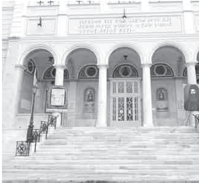
Το λάβαρο της Επανάστασης και ο Παλαιών Πατρών Γερμανός στην Παντάνασσα