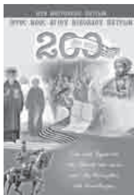
Το φυλλάδιο του ιερού ναού

Αξιοι συγχαρητηρίων είναι οι ιερείς και οι υπεύθυνοι του ιερού ναού του Αγίου Νικολάου για την όμορφη πρωτοβουλία που πήραν να στολίσουν τον περιβάλλοντα χώρο της εκκλησίας και τις σκάλες της Αγίου Νικολάου με αφορμή την εθνική επέτειο της 25ης Μαρτίου. Ήταν μια ομολογούμενη όμορφη εικόνα που απέσπασε πολλά κολακευτικά σχόλια, την ίδια στιγμή δυστυχώς που θεσμικοί φορείς της Πάτρας δεν έδειξαν την ίδια υπευθυνότητα και στερημένοι εμπνεύσεως δεν στόλισαν κεντρικά σημεία της πόλης όπως επέβαλε η ιστορικότητα των ημερών. Να σημειωθεί ότι οι ιερός ναός του Αγίου Νικολάου εξέδωσε και επετειακό φυλλάδιο με μήνυμα του Σεβασμιώτατου Μητροπολίτη Πατρών κ.κ. Χρυσοστόμου, ο οποίος επαίνεσε τους ιερείς του ναού για την όμορφη και πατριωτική κίνησή τους.