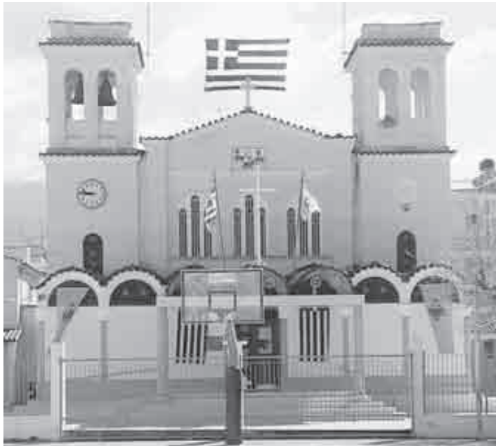
Μια τεράστια ελληνική σημαία στον ιερό ναό της Αναλήψεως