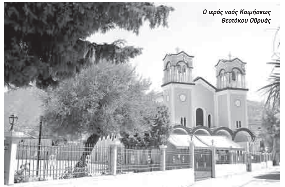
Ο ιερός ναός Κοιμήσεως Θεοτόκου Οβρυάς

Τα εγκαίνια έγιναν το 1995, αρχιερατεύοντος του τότε Μητροπολίτη Πατρών, κυρού Νικοδήμου και μάλιστα ο ναός έγινε δυσιπόστατος, αφού εκτός της Κοιμήσεως της Θε-