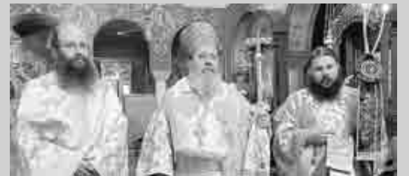
Ο Θεοφιλέστατος στον ιερό ναό Αγίου Παντελεήμονος Προαστίου

χαίρωνται, να πεθαίνουν και να ανασταίνονται για να ζήσουν τα παιδιά τους, για να ζούμε εμείς ελεύθεροι. Μας αγάπησαν από τότε, μας άφησαν κληρονομιά και προίκα μεγάλη. Μας παρέδωσαν την λαμπάδα αναμμένη. Πως πορευτήκαμε αυτά τα διακόσια χρόνια; Πως μας βρίσκει αυτή η Επέτειος όλους μας σήμερα και τι συνέχει την καρδιά μας έναντι των θυσιών εκείνων; Ποιά η στάση μας για την Ελλάδα του σήμερα, σε σχέση και με τους άλλους λαούς; Κρατήσαμε άραγε όσα εκείνοι μας παρέδωσαν; Ποιά η τιμή όλων ημών στις θυσίες και στους αγώνες των σταυραετών της λευτεριάς μας; Τι ξέρουν τα παιδιά μας γι' αυτούς τους αγώνες; Τι προσλαμβάνομε οι Νεοέλληνες από τα μνημεία που εκπέμπουν τα μηνύματα, οι τόποι, τα γεγονότα και οι ανδριάντες των ηρώων μας».