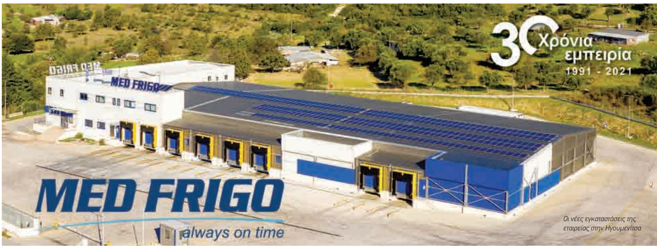
Οι νέες εγκαταστάσεις της εταιρείας στην Ηγουμενίτσα

ΧΡΟΝΙΑ ΠΡΟΚΛΗΣΕΩΝ ΤΟ 2020 Αναμφίβολα, οι αλλαγές που έφερε η πανδημία και οι επιπτώσεις που δημιουργήθηκαν λόγω της διαφοροποίησης του ισοζυγίου εξαγωγών - εισαγωγών στις οδικές μεταφορές επηρέασαν και τον δικό της τρόπο λειτουργίας. Με προτεραιότητα την ασφάλεια των εργαζομένων, των συνεργατών και των πελατών της και με σκοπό να διασφαλίσει την απρόσκοπτη