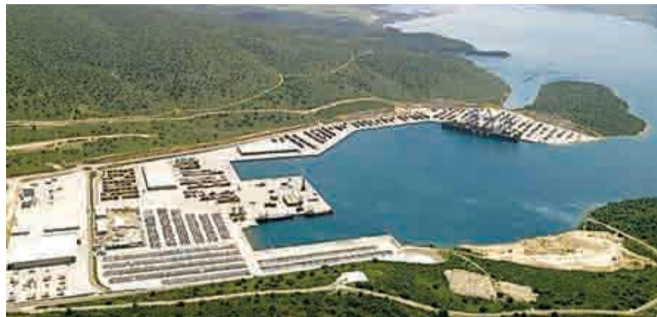
Αν υλοποιηθεί η επένδυση, η μαρίνα που θα κατασκευαστεί θα είναι η μεγαλύτερη της Μεσογείου

Στόχος των συναρμόδιων υπουργείων είναι η άρση των αγκυλώσεων, ώστε να προχωρήσει η κατασκευή ενός έργου που βρίσκεται σε διαδικασία έναρξης εδώ και περίπου 40 χρόνια. Αλλωστε, η δημιουργία μαρίνων ανά την Ελλάδα είναι μία από τις στρατηγικές επιδιώξεις της κυβέρνησης, η οποία δίνει έμφαση στην περαιτέρω ανάπτυξη του θαλάσσιου τουρισμού, με απώτερο στόχο την αναβάθμιση του ελληνικού τουριστικού προϊόντος. Στην κατεύθυνση αυτή, μάλι-