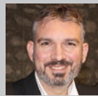
Επιμέλεια: ΚΩΣΤΑΣ ΛΑΜΠΡΟΠΟΥΛΟΣ