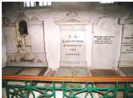
Ο τάφος του Ιωάννη Καποδίστρια στη μονή Πλατυτέρας στην Κέρκυρα. Στα δεξιά ο τάφος του αδελφού του, Αυγουστίνου