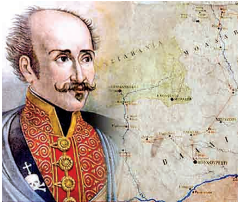
Ο πρίγκιπας Αλέξανδρος Υψηλάντης διερχόμενος τον Προύθο, σε πίνακα του Ες στη Στοά του Μονάχου. Η Ελλάδα ήταν παντού, από τον Μοριά μέχρι τις Παραδουνάβιες Ηγεμονίες και τον Δούναβη