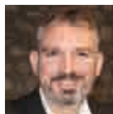
Επιμέλεια: ΚΩΣΤΑΣ ΛΑΜΠΡΟΠΟΥΛΟΣ