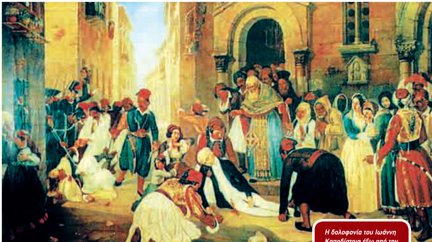
Η δολοφονία του Ιωάννη Καποδίστρια έξω από την εκκλησία του Αγίου Σπυρίδωνος στο Ναύπλιο σε πίνακα του Διονυσίου Τσάκου