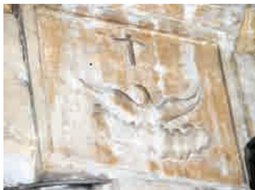
Ο φούνικας του Καποδίστρια (χρονολογία 1832) στην είσοδο της οικίας Τζίνη επί της Αγίου Νικολάου και Μαιζώνας