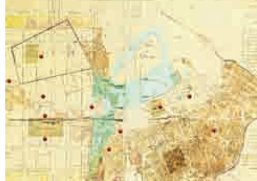
Ο χάρτης της πόλης των Πατρών, σε αντίγραφο του σχεδίου του Σταματίου Βούλγαρη από τον τοπικό μηχανικό Νικόλο Τσερούλι