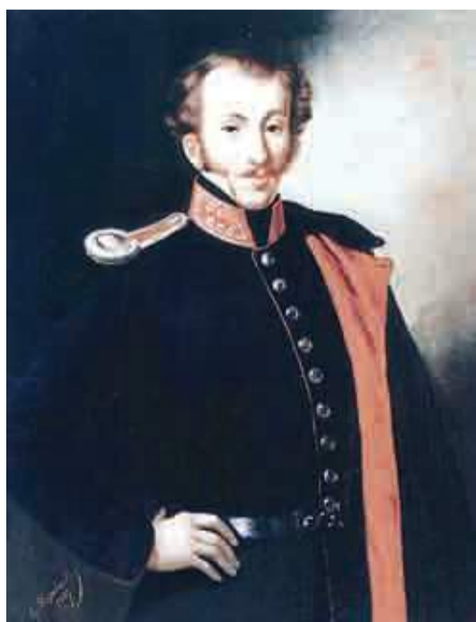
Ο πρίγκιπας Δημήτριος Υψηλάντης, αδερφός του Αλέξανδρου Υψηλάντη, πολέμησε στην πρώτη γραμμή εναντίον των Τούρκων. Η Πάτρα τον τίμησε δίνοντας το όνομά του σε οδό που βρίσκεται στην συνοικία του Σκαγιοπουλείου