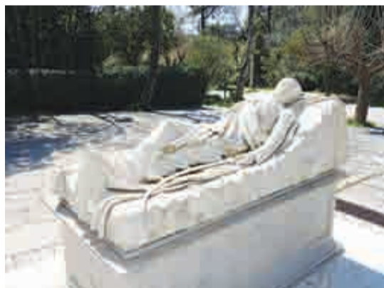
Το μνημείο του Αλέξανδρου Υψηλάντη στο Πεδίον του Αρεως, στο οποίο έχουν αποτεθεί και τα οστά του. Είναι έργο του γλύπτη Λ. Δρόση (1869), σε σχέδιο του Χρ. Χάνσεν (1842)

ΟΝΟΜΑΤΟΔΟΣΙΑ ΤΗΣ ΟΔΟΥ: ΜΕΤΑΞΥ 1875 και 1894