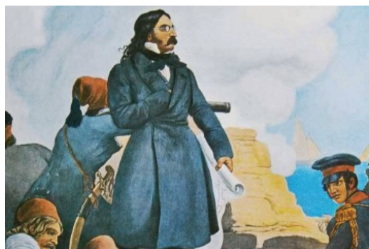
Ο Αθανάσιος Κανακάρης επέλεξε το στρατόπεδο του Αλέξανδρου Μαυροκορδάτου, κυβερνώντας ανά περιόδους αντί αυτού, κι όπως χαρακτηριστικά αναφέρει και ο Στέφανος Ν. Θωμόπουλος: «Με την πολιτεία του έσωσε πολλές φορές τη Διοίκηση»