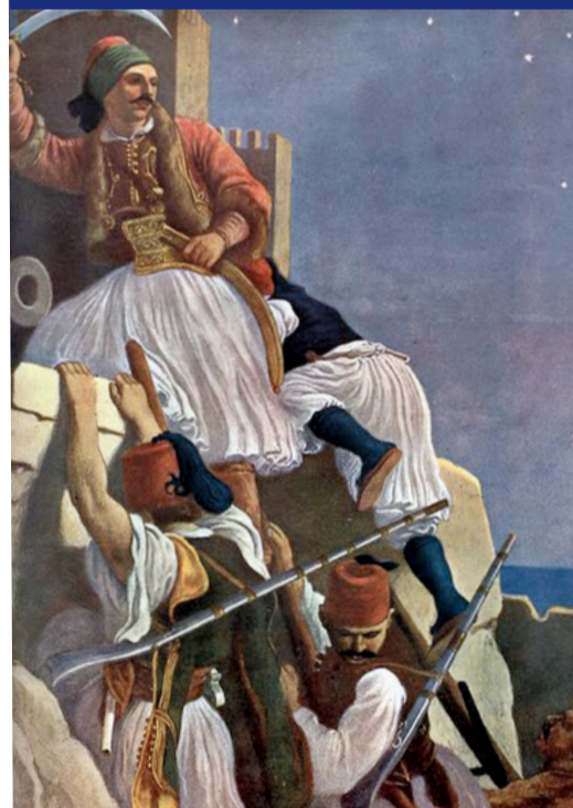
Ο Αθανάσιος Κανακάρης (σε πίνακα από την κατάληψη της Πάτρας έχαίρε σεβασμού από όλους τους συμπολίτες του, χαρακτηριζόταν ως δίκαιος και έντιμος άνθρωπος και θερμός πατριώτης, ενώ το εγκώμιό του έπλεξε και ο μεγάλος Αδαμάντιος Κοραΐς