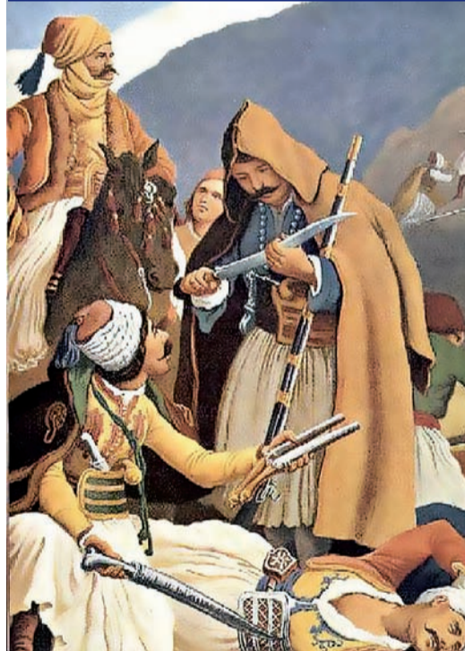
Άγγελος ή διάβολος, ο Καραϊσκάκης υπήρξε ο θριαμβευτής στη μάχη της Αράκωβας, μιας «ημέρας αναστάσεως της προ μικρού πεσούσης Στερεάς Ελλάδος» σύμφωνα με τον Παπαρρηγόπουλο