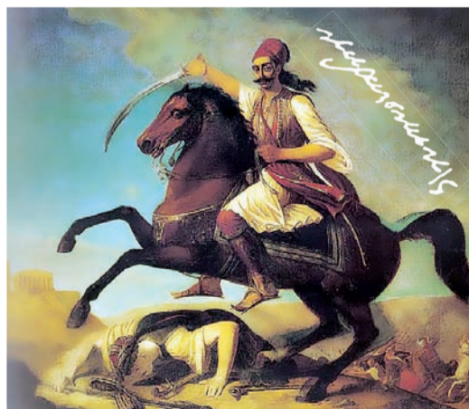
Ο Γεώργιος Καραϊσκάκης εφορμά στην Ακρόπολη, σε έργο του Γεωργίου Μαργαρίτη από το 1844. Κι όμως, ο Αλέξανδρος Μαυροκορδάτος κατηγορήσε κάποτε τον «γιο της καλογιάς» ως προδότη και συνεργάτη του Ομέρ Βρυώνη!