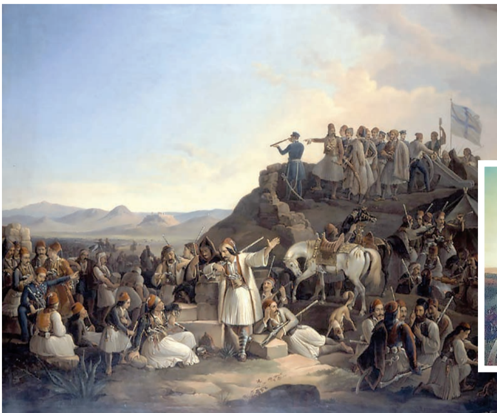
Το στρατόπεδο του Καραϊσκάκη στην Καστέλλα σε πίνακα του Θεόδωρου Βρυζάκη από το 1855. Ο στρατηγός της Ρούμελης συμμετείχε στις πολιορκίες της Αρτας και της Ακρόπολης και στις μάχες του Αγίου Βλασίου, του Κρεμμυδιού, της Αράκωβας και του Κερασινίου. Στην ένθετη φωτογραφία ο Γεώργιος Καραϊσκάκης που πολεμούσε με την σημαία και το σπαθί στο χέρι