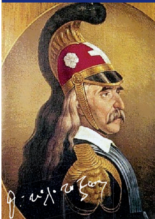
Ο Θεόδωρος Κολοκοτρώνης είναι μεγάλη μορφή της Επανάστασης

Η εξάρτηση, τα όπλα κι άλλα προσωπικά αντικείμενα του Θεόδωρου Κολοκοτρώνη, ο οποίος έγραψε τα εξής μετά την άλωση της Τριπολιτσάς: «Όταν έμβηκα εις την πόλιν, με έδειξαν τον πλάτανο εις το παζάρι όπου εκρέμαγαν τους Ελληνας. Αναστέναξα και είπα: "Αϊντε, πόσοι από το σόγι μου και από το έθνος μου εκρεμάσθηκαν εκεί", διέταξα και το έκοψαν»