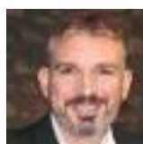
Επιμέλεια: ΚΩΣΤΑΣ ΛΑΜΠΡΟΠΟΥΛΟΣ