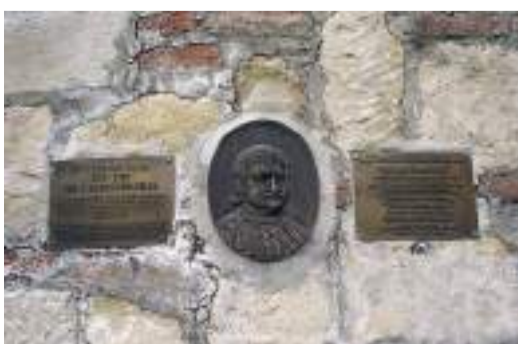
Αναμνηστική πλάκα στον πύργο Νεμπόισα του Βελιγραδίου, εκεί όπου ο Ρήγας Βελεστινλής βρήκε φρικτό θάνατο από τους Οθωμανούς