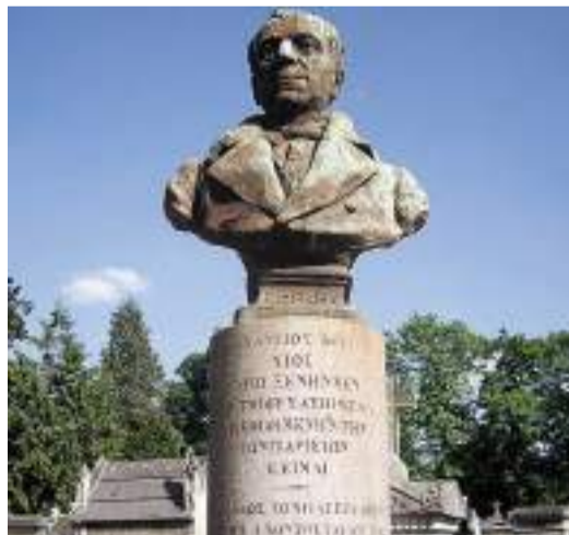
Ο τάφος του Κοραΐ στο κοιμητήριο του Μονπαρνάς, στον οποίο είναι χαραγμένη η επιγραφή που είχε συντάξει ο ίδιος: «Αδαμάντιος Κοραΐς Χίος Ὑπὸ ξένην μὲν ἴσα δὲ τῇ φυσάσῃ μ' Ἑλλάδι πεφιλημένην γῆν τῶν Παρισίων κείμαι»