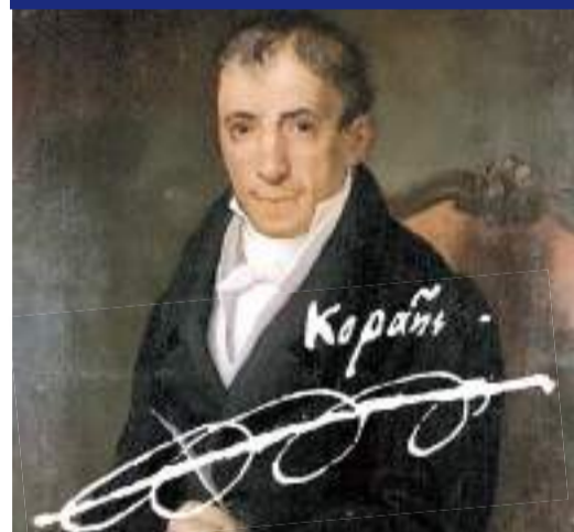
Η υπογραφή και πίνακας του Αδαμάντιου Κοραΐ, ο οποίος αντιτάχθηκε στη Γαλλική Επανάσταση κατά τη ριζοσπαστική της περίοδο (1792-1795), περιγράφοντας την ως «βάρβαρη εποχή», υπό την κυριαρχία «κανιβάλων», «δολοφόνων» και «ληστών»

ΑΚΟΜΗ ΚΑΙ ΣΗΜΕΡΑ κάποιες απόψεις του αποτελούν σημείο τριβής. Η προσφορά του, όμως, στον ελληνισμό είναι ανεκτίμητη.