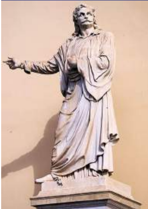
Η υπογραφή και ο ανδριάντας του Ρήγα Φεραίου