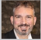
Επιμέλεια: ΚΩΣΤΑΣ ΛΑΜΠΡΟΠΟΥΛΟΣ