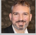
Επιμέλεια: ΚΩΣΤΑΣ ΛΑΜΠΡΟΠΟΥΛΟΣ