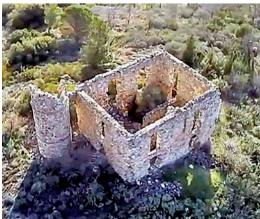
Ο Πύργος της οικογένειας των Ρούφων στους πρόποδες του Παναχαϊκού όρους, βορειοανατολικά από το χωριό Ρωμανός και πλησίον του οικισμού Ζάστοβα