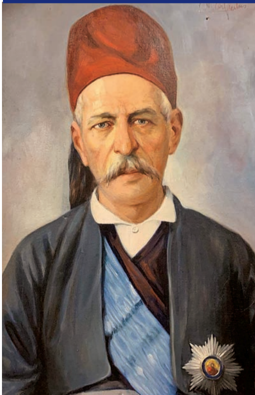
Ο Μπενιζέλος Ρούφος (πίνακας από το ιστορικό αρχείο Ε. και Α. Σκιαθά) υπήρξε πρωταγωνιστής και στην Επανάσταση του 1821, αλλά και αργότερα στις πολιτικές και πολιτειακές εξελίξεις του νεοσύστατου Ελληνικού βασιλείου