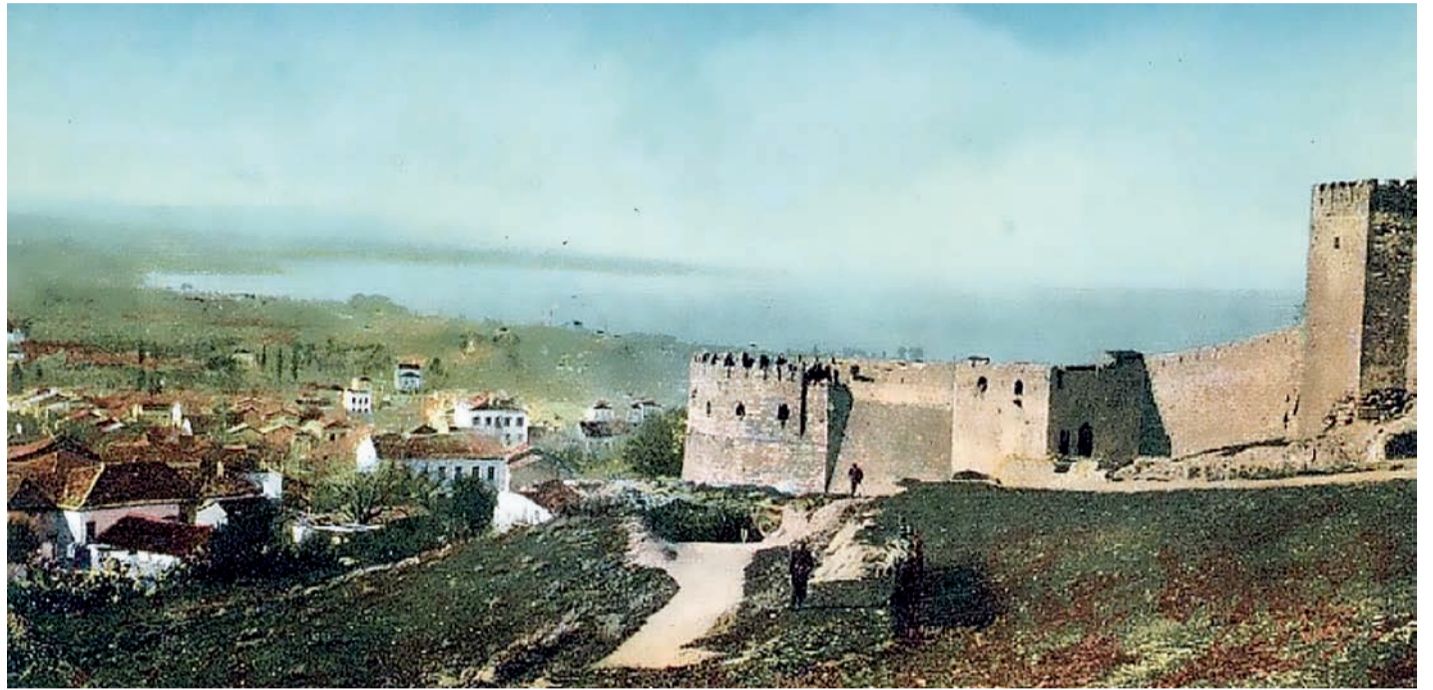
Το Κάστρο της Πάτρας, στην πολιορκία του οποίου συμμετείχε και το σώμα του Μπενιζέλου Ρούφου, πέρασε στα χέρια των Ελλήνων μόλις το 1828 μετά την παράδοση της τουρκικής φρουράς στον Γάλλο στρατηγό Μαιζόν