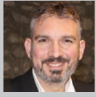
Επιμέλεια: ΚΩΣΤΑΣ ΛΑΜΠΡΟΠΟΥΛΟΣ