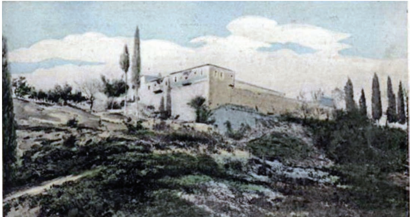
Με την ανακατάληψη της μονής του Γηροκομείου τον Αύγουστο του 1821, αναδείχθηκε το στρατηγικό μυαλό του Παναγιώτη Καρατζά, με τους Τούρκους να χάνουν στις συγκρούσεις συνολικά 100 στρατιώτες και αξιωματικούς